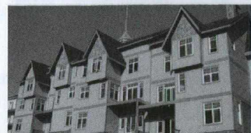
Vue du système de charpente métallique légère à Dalian, en Chine, au début du projet (à gauche), et du produit fini.

Un nouveau bulletin électronique SEAscape : votre fenêtre sur l'Asie du Sud-Est (voir page 7)