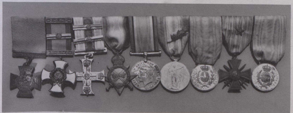
Las medallas pertenecientes a William George Barker incluyen (de izquierda a derecha): la Cruz de la Victoria, la Orden al Servicio Distinguido y el galón correspondiente; la Cruz Militar y 2 galones, la Medalla 1914-15, la Medalla Británica de la Guerra, la Medalla de la Victoria y la Oja de Roble, la Medalla italiana de primera clase, la Croix de Guerre de Francia, con su estrella y la Medalla italiana de segunda clase.

Se le atribuye haber destruido un total de 50 aviones enemigos durante la guerra. En reconocimiento a sus servicios, se le otorgó en dos ocasiones la Orden de Servicio Distinguido y tres Cruces Militares. El gobierno italiano le otorgó la Medalla de Plata al Valor Militar. También fue honrado con la Croix de Guerre de Francia. El Teniente Coronel Barker sirvió en la Fuerza Aérea Canadiense hasta 1926. Murió en 1930.