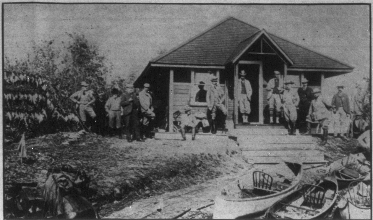
V. György angol király, amikor legutoljára Kanadában járt 1911-ben, nagy élvezettel vadászott a Manitoba Lake vizsárványokban dús vidékén. A fenti kép azt a jelenetet ábrázolja, amint a vadásztársaság eredményes portyázás után megpihen a tóparti vadászlakban. Az ajtóban áll V. György.

AZ EGYESÜLTÁLLAMOKBELI chicagói világkiállításon bemutatják a világ egyik legszebb drágakövét, a 78 karátos Nasakgyémántot, melyet a 18. százalkban a nassaki (India) Shilva-templomból raboltak el, ahol egy istenszobor szemé volt. A gyémántot láthatatlan sugarakkal övezett erős páncélszekrényben állítják ki, amelyet fegyveres és gázárcos őrk őriznek. Ha a páncélszekrény ellülő üvegfalát a legcsekélyebb ütődés éri, az a díborbár-