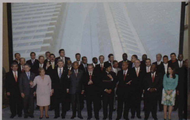
Dirigeants au Sommet de 2009 : lorsque tout fonctionne bien, la logistique est invisible.