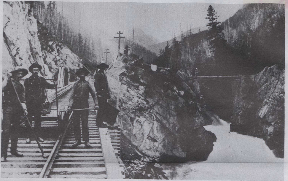
Dando servicio a una sección de vía en el Cañon del Beaver River de la C.B.

al Oeste de Canadá. En carteles, pinturas y folletos de la CP se promete a los colonos una vida fácil y próspera a lo largo de la línea principal del ferrocarril. En contraste, las cartas y fotografías de los primitivos colonos muestran la, a menudo, realidad dura de la vida fronteriza.