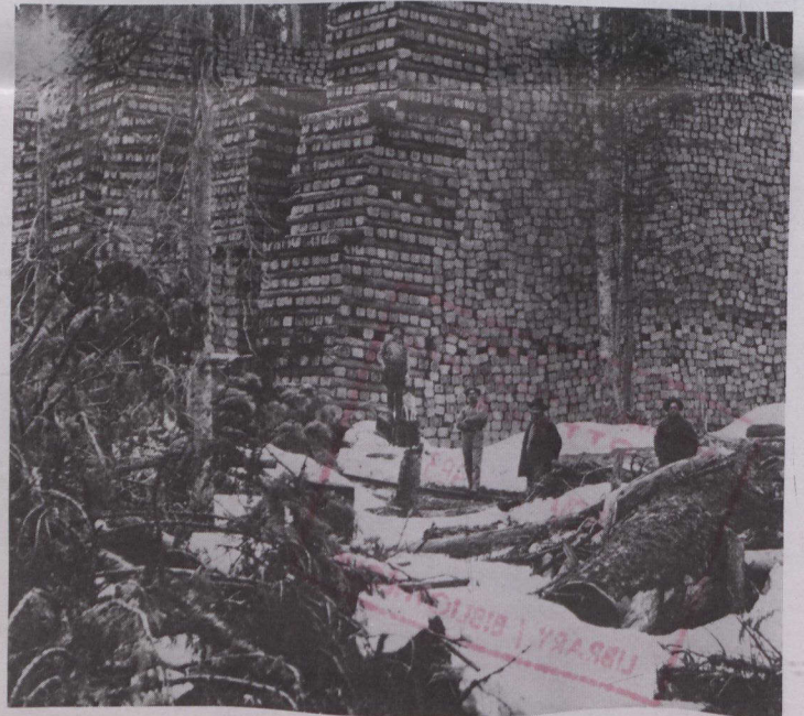
Construcción se utilizaron 2.000 de traviesas de pino de la C.B.