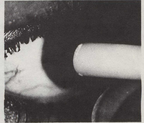
L'écho-oculomètre (ci-dessus): mesure rapide et indolore des paramètres oculaires.

Un zoologiste de l'Université de la Colombie-Britannique travaille à la mise au point d'une série de tests permettant la détection des agents cancérogènes présents dans les composés chimiques utilisés actuellement par l'industrie et l'agriculture. Étant donné qu'il n'est pas toujours possible d'appliquer aux humains les résultats de tests effectués sur les microbes, ce chercheur met au point une méthode d'essai fondée sur l'emploi de tissus humains. Des cellules humaines, que l'on peut prélever chez des personnes normales ou chez des sujets exposés à des risques de cancer plus élevés, sont cultivées dans des milieux spéciaux et exposées à des mutagènes en puissance. On étudie ainsi non seulement la formation de mutations mais aussi toute modifica-