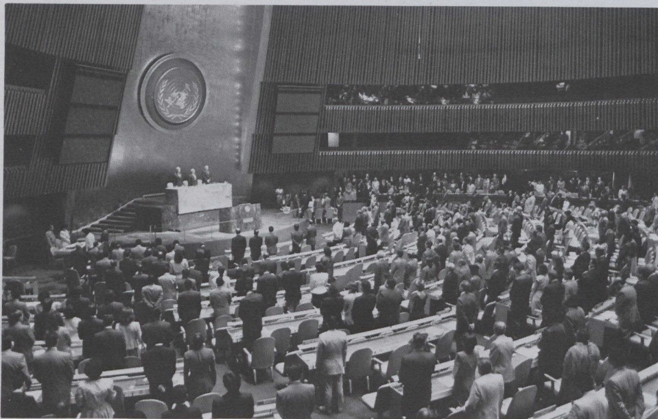
Vue générale de l'ouverture de la 46 e session de l'Assemblée générale des Nations Unies (septembre 1991).