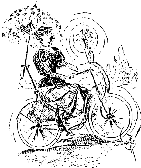
La dernière invasion américaine.

La femme.—Oui cher, et tu en voudrais encore, je suis sûre ? Ah ! tu es un connaisseur, toi.