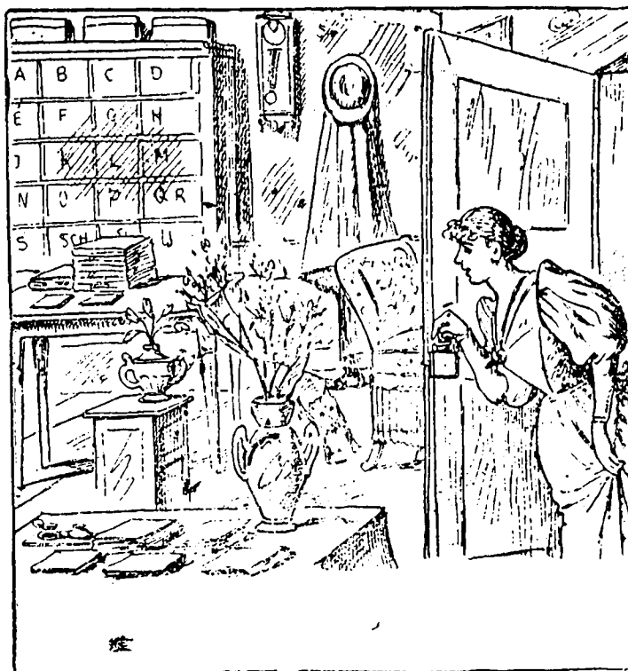
—Monsieur est dans son cabinet de travail, me dit-on. Le voyez-vous ?