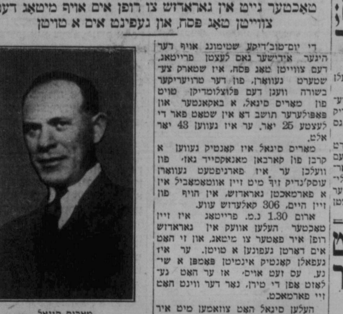
אירעל פון בעכמארא

אומאָרד-נונגען אומאָרד-נונגען אומאָרד-נונגען אומאָרד-נונגען