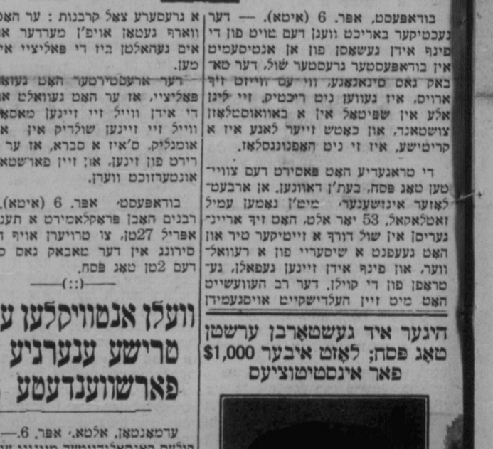
אירעל פון בעכמארא