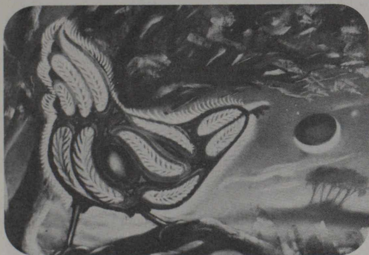
"La gallina gris"