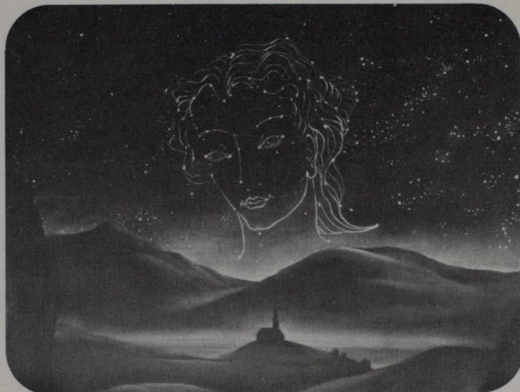
"L'haut sur ces montagnes"

Personaje insólito, McLaren queda al margen de cualquier intento de clasificación en la historia de la cinematografía. Paciente como un miniaturista de la edad media, prefiere realizar sus obras literalmente "él mismo". Con una pluma ordinaria, un frasco de tinta china y un poco de película, liberó a la cinematografía de todas las restricciones que habían entre el artista