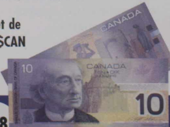
Billet de 10 $ CAN

En qualité de peintre, Jorge a dessiné et gravé des billets de banque et des pièces de monnaie pour la Banque du Mexique et pour plusieurs pays d'Amérique latine. En outre, il a dessiné six pièces d'argent commémoratives pour la Coupe du monde de soccer 1986 à Mexico, dont l'une a remporté le prix international de numismatique de la ville de Varèse, en Italie.