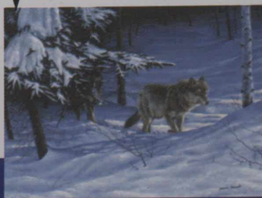
From Way Up North (huile sur masonite, 1998)

Les créations de Germán ont été exposées au Canada, en Colombie, en Chine, à Hong Kong et aux États-Unis, et ses oeuvres figurent dans des collections privées réparties dans le monde entier. Ses murales spectaculaires ornent des édifices au Canada et en Colombie. Il a reçu des prix artistiques d'institutions du Canada, de la Colombie et des États-Unis.