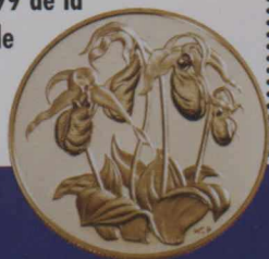
Pièce d'or 1999 de la Monnaie royale canadienne

Son assortiment unique de talents pour l'art, pour l'agrandissement et pour le travail de précision l'a amené en 1997 à la Monnaie, où il est chargé de l'esquisse, du modelage et de la création de pièces canadiennes et étrangères. Parmi ses créations préférées, mentionnons la pièce d'or de 1999 sur l'Île-du-Prince-Édouard dans la série des emblèmes floraux provinciaux, la série Lunaire, dont la populaire pièce au Dragon de l'an dernier, et la pièce Fierté de janvier 2000.