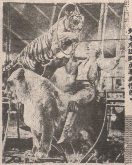
對着鬼猛虎虎無懼色。