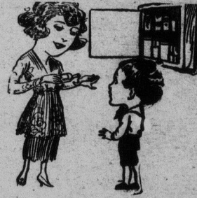
PREND TA MEDICINE