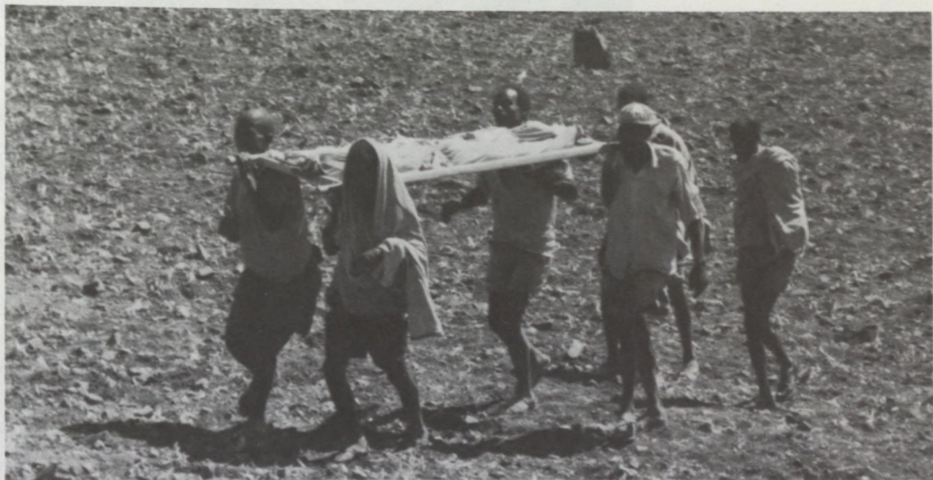
Victime de la famine au camp de Bati, en Éthiopie.