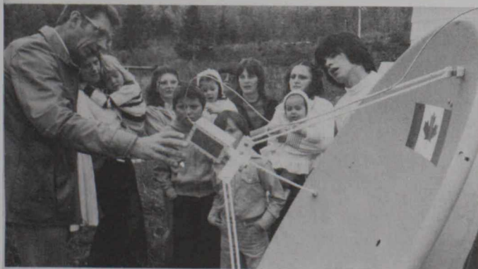
Kanadas Pioniertat: TV-Programm direkt aus dem Weltraum

Daß diese dichte Verkabelung Probleme aufwirft, die über den wirtschaftlichen Aspekt der Verkaufbarkeit neuer Technologien weit hinausreichen, hat Kanadas amtierender Minister für das Fernmeldewesen, David MacDonald, in der kurzen Zeit, die er im Amt ist, bereits mehrfach unterstrichen. „Wenn wir den Herausforderungen der neuen Technologien und ihren kulturellen Auswirkungen nicht – und nicht jetzt – begegnen, werden wir durch unser Zögern diesem Land und den Möglichkeiten der Kanadier, ihre kulturelle Identität auszudrücken, schweren Schaden zufügen.“