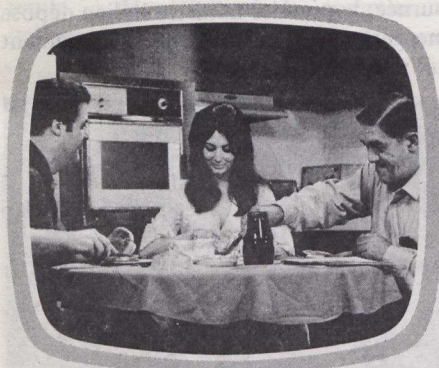
Rue des Pignons a été le deuxième plus long téléroman de Radio-Canada (1966-août 1977).