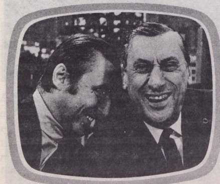
Jacques Normand et Roger Baulu ont divertifié les Canadiens dans Les Couche-Tard.