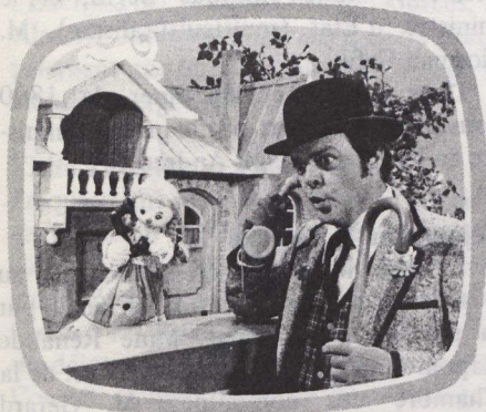
L'émission enfantine Bobino détient un record de durée – créée en 1957, elle continue de faire la joie des enfants.

• Pour Earl Cameron, le souvenir le plus marquant de sa carrière remonte au 3 mai 1965, jour où: "nous avons transmis en direct, depuis les studios de la BBC à