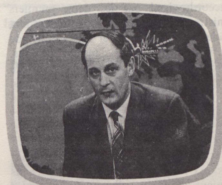
René Lévesque, animateur de l'émission d'information Point de mire (1956-1958).