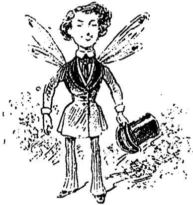
D'ARTAGNAN LE JOUR DES NOCES

D'Artagnan était beau à voir. Il paraissait heureux comme un papillon bleu.