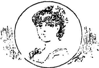
LE PORTRAIT DANS LE MÉDAILLON

Le mariage de notre héros avec la belle Cordélie avait été décidé le lendemain de l'entrevue de cette dernière avec la Milady Mordante. Celle-ci après avoir reconnu le portrait renfermé dans le médaillon de la jeune choriste de l'Opéra, lui demanda d'une voix entrecoupée de sanglots.