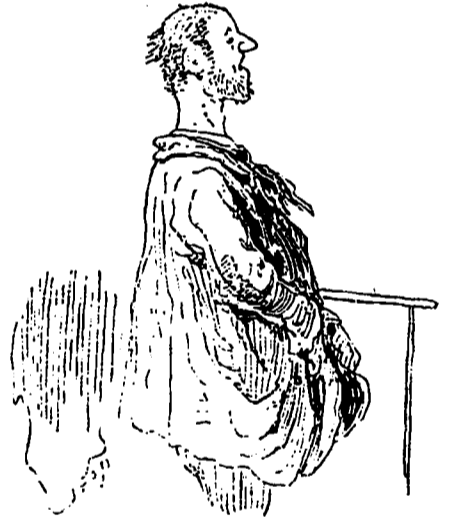
PORTHOS DEVANT LE RECORDER.

Atroce a pris le "Gold Cure" et est devenu membre de la Société de Tempérance de la paroisse du Sacré-Coeur.