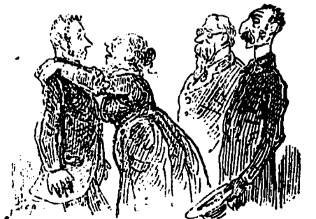
LE SERMENT DE BISTOQUET

Bistoquet a fait serment en présence de deux de ses amis de ne plus lever le coude pendant le restant de ses jours.