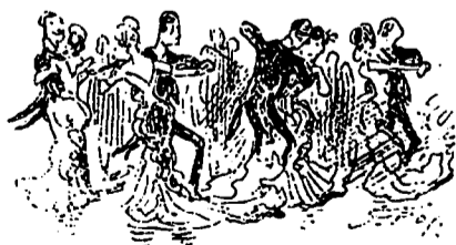
LE BAL CHEZ VERVAIS

Et puis le soir toute la noce a pris le tramway et s'est rendue à l'Hôtel Vervais où il y eut un bal qui restera mémorable dans les fastes du chemin du Sault.