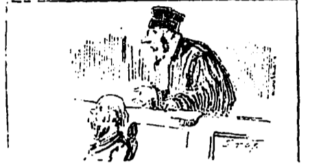
BONNACIEUX EN COUR

Son mari le jour où il est sorti de prison, a récidivé. Il a paru devant la cour du Banc de la Reine sous la prévention d'avoir refusé à sa femme les choses nécessaires à la vie. Grâce à l'éloquent plaidoirie de son avocat,