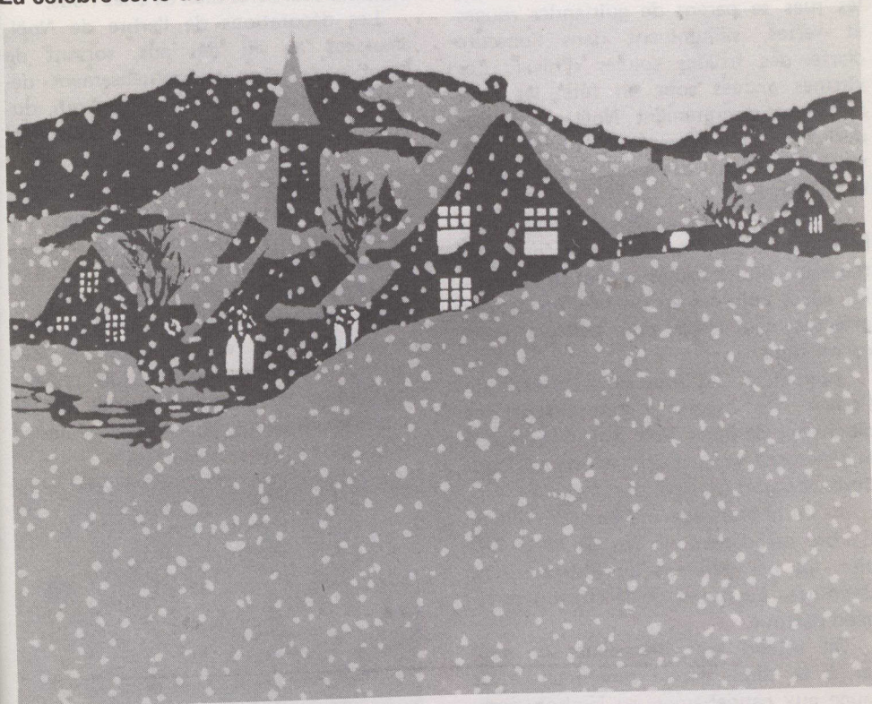
Village au crépuscule, 1931, sérigraphie de A. Y. Casson.

Les Archives publiques du Canada présentent jusqu'au 8 janvier 1984, en collaboration avec Hallmark Cards Canada, une exposition intitulée Cartes de Noël, série des « Peintres du Canada — 1931 » .