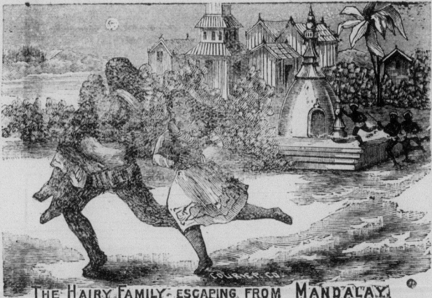
THE HAIRY FAMILY ESCAPING FROM MANDALAY

La plus considérable et la plus riche entreprise d'amusements qu'il y ait sur la surface du globe