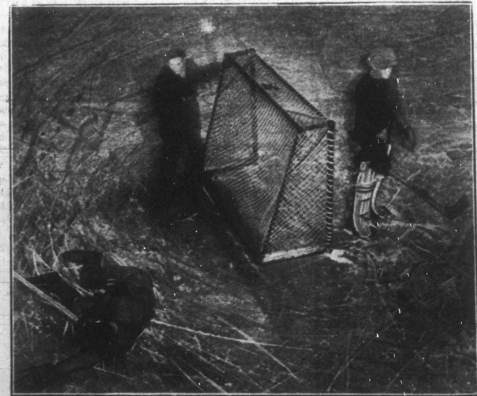
"The world's fastest game..." — "A világ legsebesebb mérkőzése": a jéghockey, magyarosan haki, mely száz és százszor sportbarátot tart nap-nap után izgalomban. A Lake Placid-en február 4-től 13-ig tartott olimpiai mérkőzések során is óriási érdeklődéssel kísérték az egyes nemzetek jéghakizóinak mérkőzését. Képiunk éppén egy izgalmas jelenet látható a kapu előtt.

Kanadában a rágógumitól eltekintve Wrigley arról volt nevezetes hogy az évenként Torontóban tartott nemzeti kiállítások alkalmával rendezett uszó és sportversenyeket sok ezer dollárral pártolta. Ennél sokkal nagyobb feltűnést keltett — különösen Nyugatkanadában — az a nagyszerűen bevált hirdetés terve, hogy többmillió bushel búzát vásárolt, amikor a buzaárak éppén a legalacsonyabbak voltak. Wrigley ezáltal nem spekulálni akart az alacsonyan vásárolt búzával, hanem a kereslet élénkítésével a buza árfolyamat akarta emelni és ezáltal viszonzni óhajította azt a sok pénzt, amit a kanadaiak centenként adtak neki az évek folyamán.