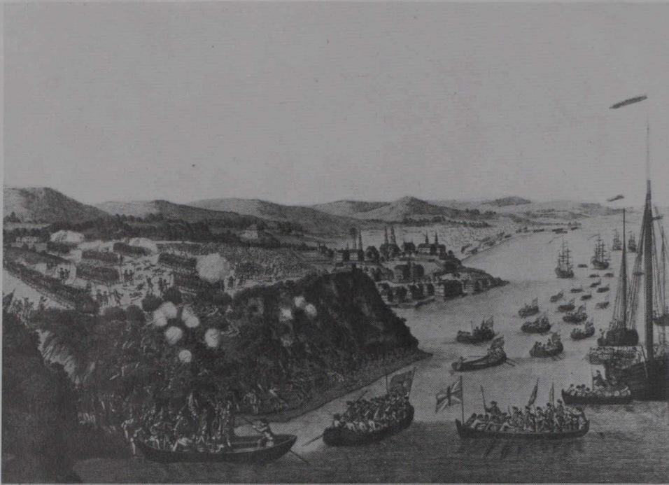
View of the Taking of QUEBEC, September 13, 1759 This is the manner of the British attack, across the narrow waterway of the harbor, by means of a double line of boats, which defended a small artificial path, through which the troops were to pass. The success of the assault, obtained over the French regulars, militia and Indians, which produced the surrender of Quebec.