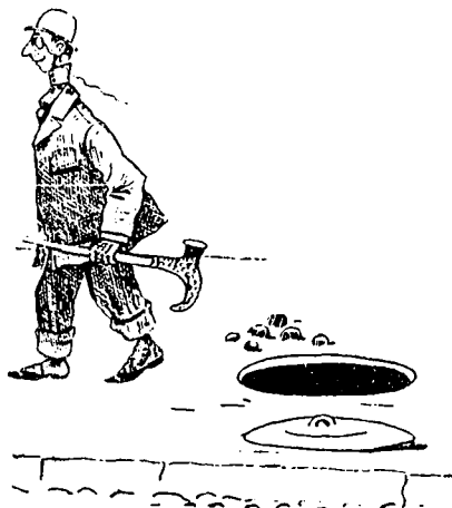
Légende sans paroles.