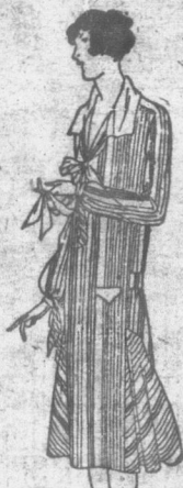
McCall Printed Pattern 4463