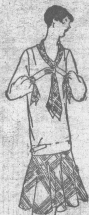
McCall Printed Pattern 4443