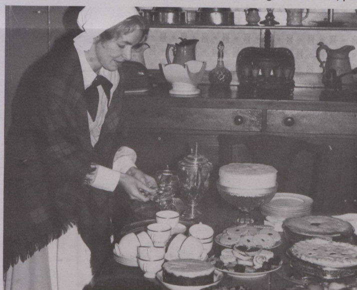
Las actividades navideñas en el castillo Dundurn de Hamilton, Ontario, incluyen visitas al mismo y degustación de manjares en su cocina.