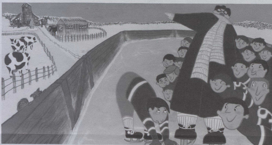
Uno de los cuadros pintados por Sheldon Cohen sobre cartón de pasta de madera en 1984 para ilustrar el libro "La camiseta de Hockey", expuestos al público en el Museo McCord de Montreal.

En el Planetario McLaughlin del Museo Real de Ontario de Toronto se presentará el largometraje La estrella de la Navidad . En esta película se analizan diversas teorías sobre la estrella de Belén y se presenta el firmamento nocturno tal como brillaba la noche en que nació Jesucristo. Esta es la cuarta versión de este espectáculo para grandes y chicos, que se ha venido presentando