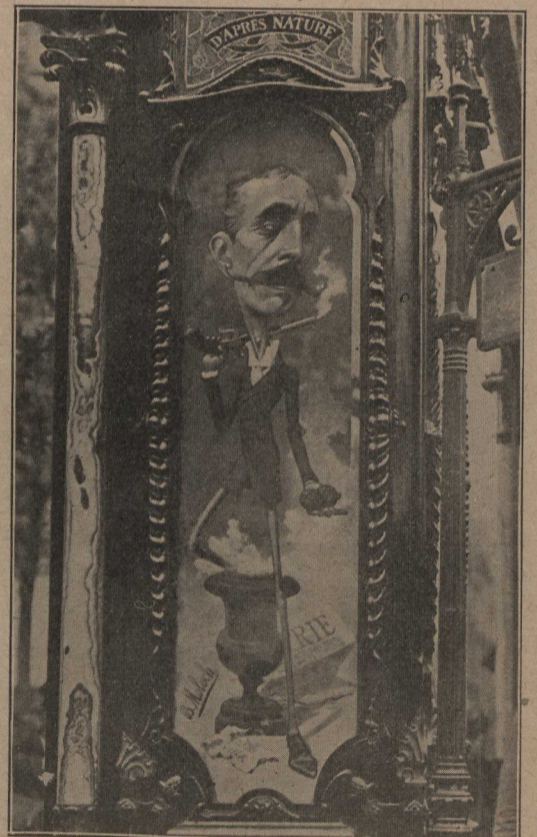
A Paris. — Caricature du fameux député "chauvin" Millevoye, directeur de la "Patrie" (de Paris). — Un magasin d'habillements expose chaque quinzaine, à sa devanture, deux caricatures de personnalités en vue. Dimensions des caricatures, 9 pieds de haut.