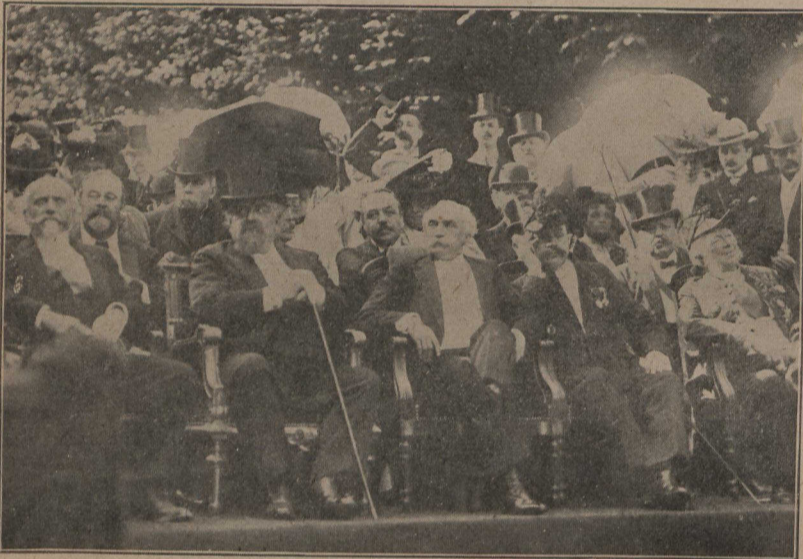
A Paris. — Le 10 juin 1906, le ministre français de l'Instruction publique, assistant à l'inauguration de la statue d'Alexandre Dumas fils.