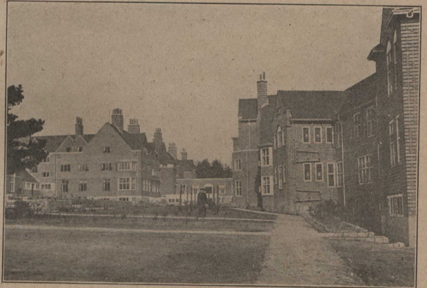
En Angleterre. — Vue partielle du Sanatorium de Midhurst, inauguré dernièrement par Sa Majesté le roi Edouard VII.