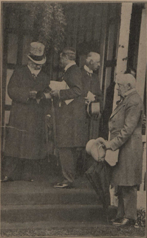
En Angleterre. — S. M. Edouard VII, recevant les administrateurs de l'exposition agricole de Derby. A droite, lord Coventry.