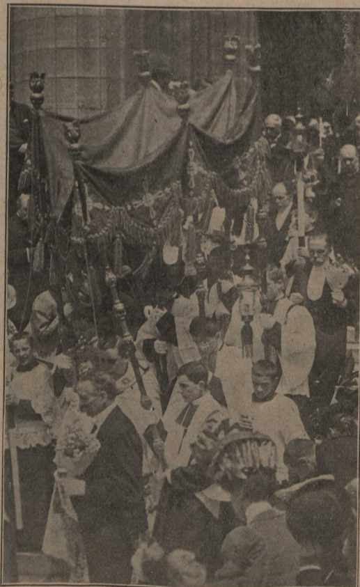
A Paris. — La Fête-Dieu célébrée à la Madeleine, de Paris, en juin 1906.