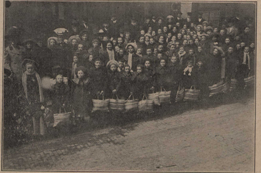
A Londres. — Une centaine de fillettes en partance pour le Canada, où elles sont arrivées récemment. Ces jeunes émigrantes, âgées de 8 à 16 ans, venaient du village Homes, où se trouve la succursale du refuge du Dr Barnados Homes, d'Ilford. Dans ce refuge, environ 13,000 fillettes sont éduquées et soignées. Elles vivent dans 63 cottages, qui occupent, avec leurs dépendances, une superficie de 60 acres.