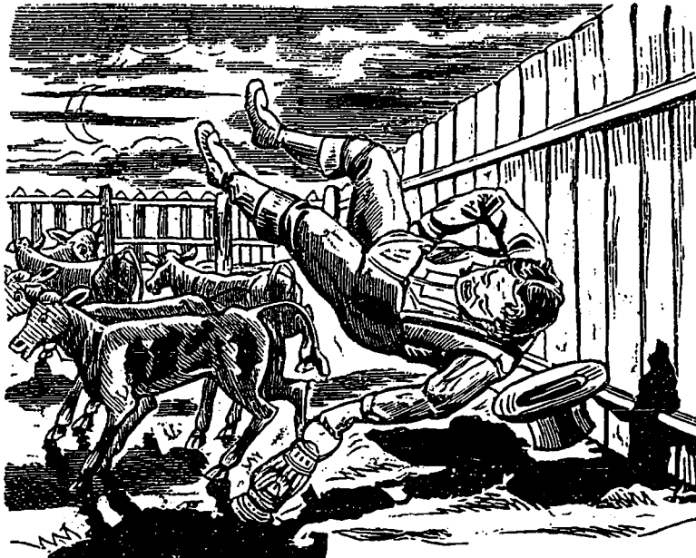
Ce pauvre ECLAIREUR finit par tomber dans le Parc aux VEAUX. Il fera maintenant de la politique conservatrice ab ovo . (Ah! beau veau!) pour les abrutis de l'ECLAIREUR.

—C'est le cas. C'est une folie pour laquelle je mériterais d'être