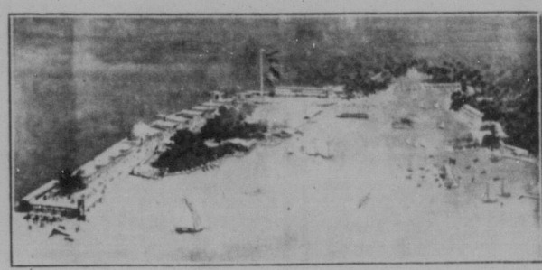
Skiss över utställningsområdet vid Djurgårdsbrunnsviken.