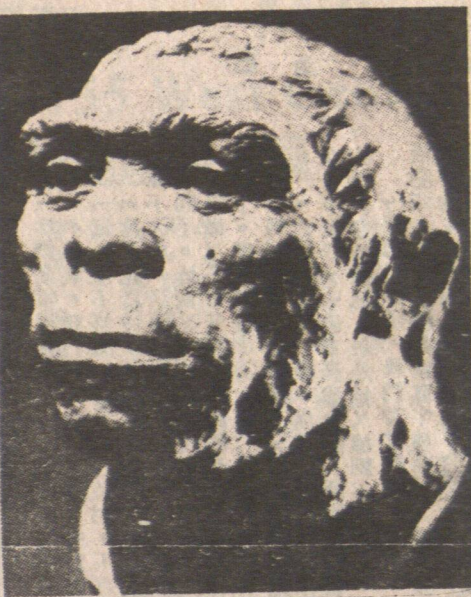
畫家筆下的北京人模樣。

北京人頭骨的下落，一直是一個謎。科學家們試圖通過各種方法來尋找北京人頭骨的下落。但是，至今為止，還沒有找到北京人頭骨的下落。這使得科學家們對北京人的存在產生了懷疑。 北京人頭骨的下落，一直是一個謎。科學家們試圖通過各種方法來尋找北京人頭骨的下落。但是，至今為止，還沒有找到北京人頭骨的下落。這使得科學家們對北京人的存在產生了懷疑。 北京人頭骨的下落，一直是一個謎。科學家們試圖通過各種方法來尋找北京人頭骨的下落。但是，至今為止，還沒有找到北京人頭骨的下落。這使得科學家們對北京人的存在產生了懷疑。