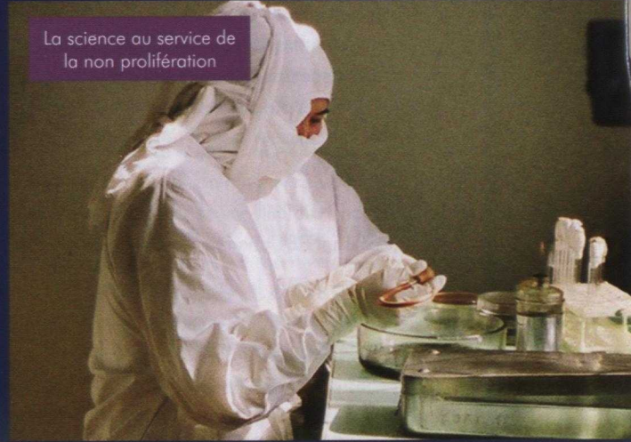
La science au service de la non prolifération