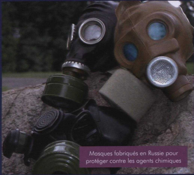
Masques fabriqués en Russie pour protéger contre les agents chimiques