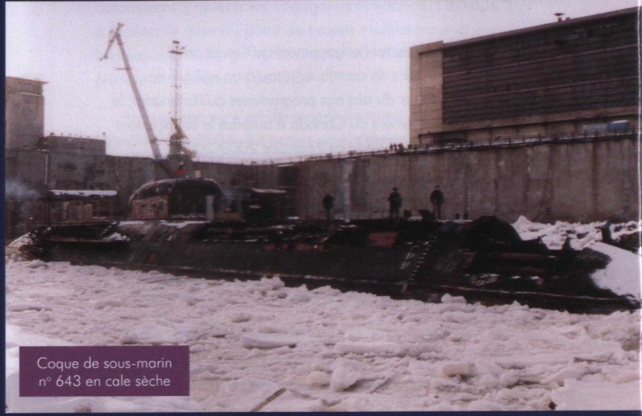
Coque de sous-marin n° 643 en cale sèche