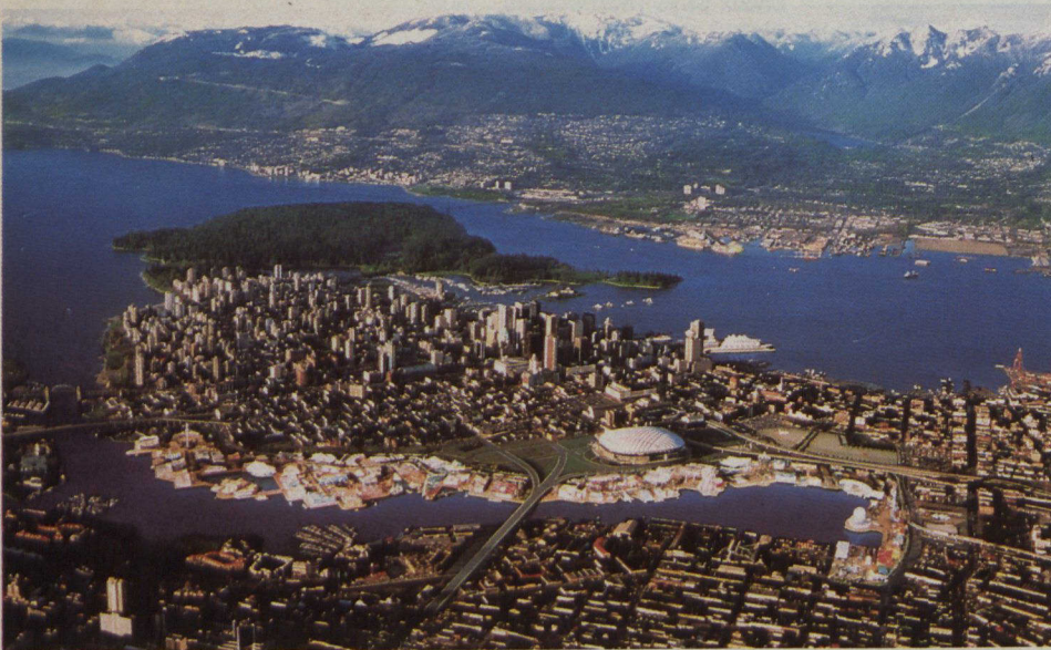
Panorama de Vancouver montrant l'emplacement principal de l'Exposition sur False Creek et Canada Place dans le port.