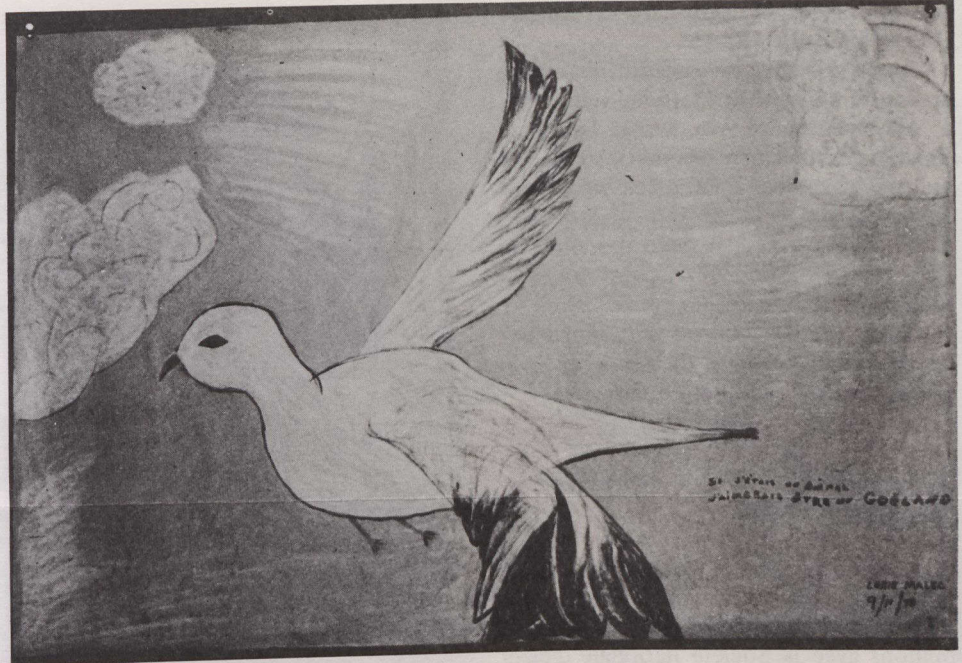
Si j'étais un animal, j'aimerais être? pastel à l'huile réalisé par une femme de 63 ans ayant eu un accident cérébro-vasculaire.

L'Atelier a été créé il y a neuf ans par M. Maurice Brault, qui utilise le dessin pour amener ses élèves à s'exprimer et à raconter graphiquement leur évolution. "La thérapie par l'art, c'est avant tout d'aider le malade à actualiser l'image innée dans le rêve, en réactivant son geste créateur plus ou moins paralysé par des contraintes ou des fixations physiques ou psychiques. Ce moyen d'exploration peut être aussi un instrument de diagnostic pour les psychiatres et les psychologues",