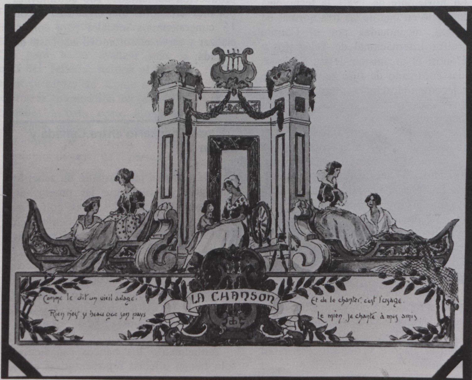
Dibujo de Jean-Baptiste Lagassé de una carroza alegórica para un desfile.

En Canadá hay 52 idiomas o dialectos indios que pertenecen a diez grandes