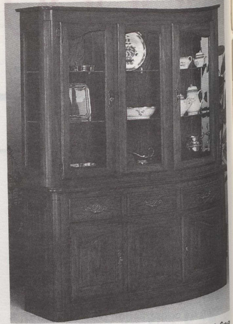
Buffet de style traditionnel en chêne couleur cognac

dans tout le Canada, aux États-Unis et dans d'autres pays étrangers. Les concepteurs canadiens ont gagné de nombreux prix d'importance tant au Canada qu'à l'étranger et sont membres actifs des principaux organismes étrangers de conception de meubles.