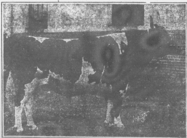
PENSHURST MISCHIEF STAR, taureau Ayrshire, Grand Champion à l'Exposition d'Ormslow.

Ferme expérimentale centrale, Ottawa, Ont.