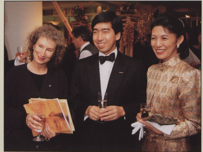
Author Margaret Atwood with Their Imperial Highnesses Prince and Princess Takamado at the "Today's Japan" opening.

L'écrivaine Margaret Atwood et Leurs Altesses Impériales le Prince et la Princesse Takamado à l'ouverture de l'exposition "Le Japon d'Aujourd'hui."