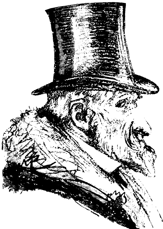
NE PERD JAMAIS