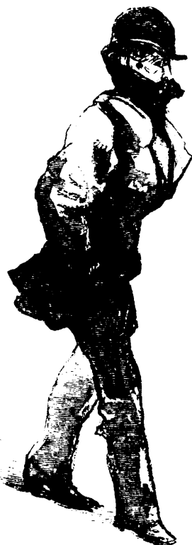
NE SPÉCULE PAS