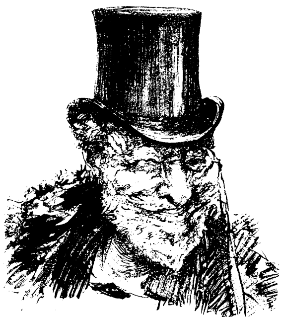
IL Y EN A QUI RIENT