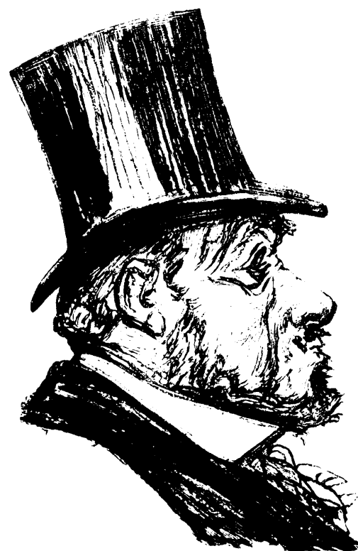
NE VOUS Y FIEZ PAS