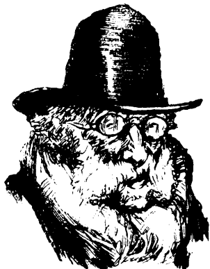
PRÊTE À LA PETITE SEMAINE