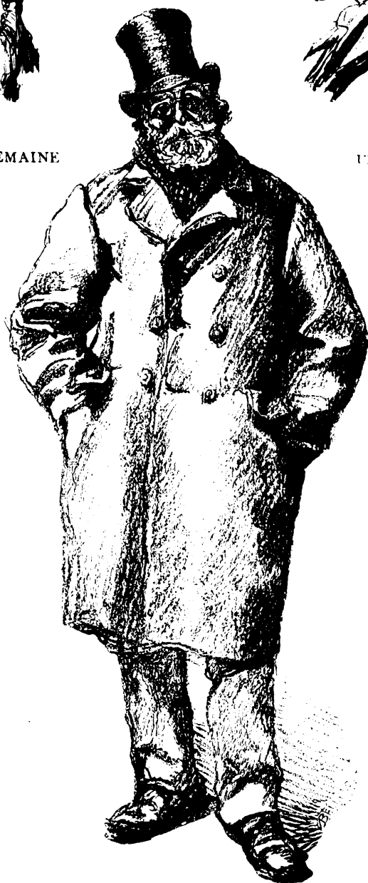
NE RISQUE RIEN LA BOURSE ET LES BOURSIERS.