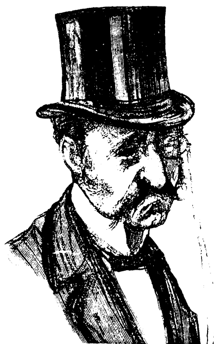
IL Y EN A QUI NE RIENT PAS