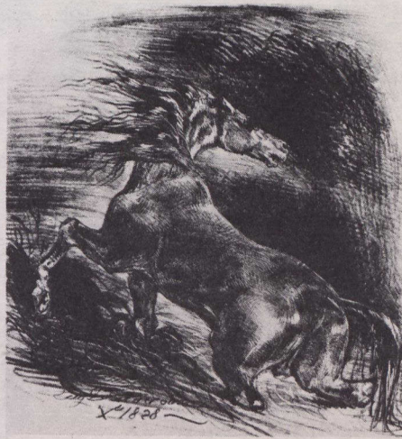
Art Gallery of Ontario