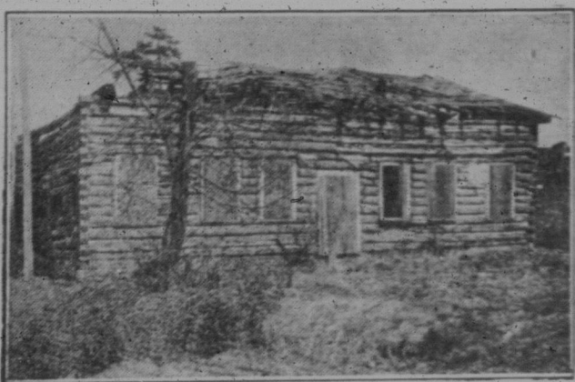
Ein canadisches Wohnhaus aus der Zeit vor hundert Jahren. In Guelph, Ontario, ist man heute damit beschäftigt, das alte Gebäude wieder aufzubauen, um es als Museum zu verwenden. Die heutige Guelph ist ein prosperierendes Zentrum mit einer Bevölkerung von über 100.000 Einwohnern.