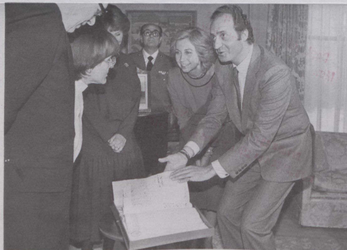
Los Soberanos de España (derecha) en una elegante pose durante su visita a Ottawa.