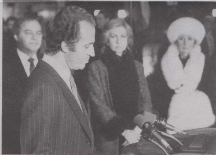
Don Juan Carlos I dirige la palabra al comité de bienvenida a su llegada a Canadá.

Teniente Gobernador les ofreció un almuerzo. En esta ciudad visitaron el Parque Cuadra, cercano al puerto, donde el Rey descubrió el monumento a Francisco Bodega y Cuadra. En contestación al discurso del Ministro de Hacienda, Sr. Lalonde, durante el almuerzo en Montreal el 14 de marzo, Don Juan Carlos I predijo relaciones más estrechas entre Canadá y España con estas palabras: "Confío que nuestros pueblos establecerán progresivamente relaciones más estrechas y que caminarán juntos hacia un futuro de paz y prosperidad".