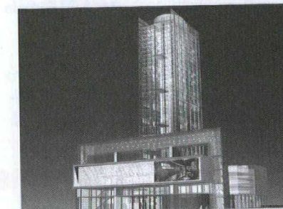
Guangdong Mobile Communications, Guangzhou.