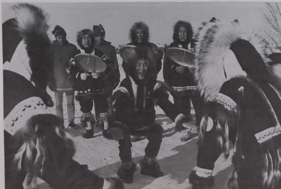
Lors du Folk on the Rocks, à Yellowknife (Territoires du Nord-Ouest), la danse du tambour fait partie des activités des Jeux d'hiver de l'Arctique.