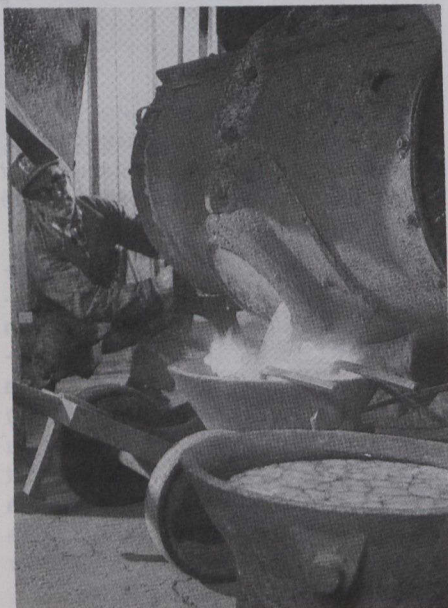
Coulage de l'or dans une mine aurifère, près de Yellowknife (Territoires du Nord-Ouest).

Selon le commissaire du pavillon des ter-