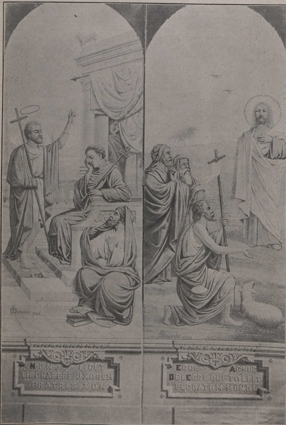
LES NOUVEAUX TABLEAUX DU CHŒUR DE L'ÉGLISE ST-JEAN BAPTISTE DE MONTRÉAL, peints par M. E. Meloche. St-Jean Baptiste reprochant à Hérode son adultère. St-Jean Baptiste reconnaissant le Christ comme fils de Dieu.