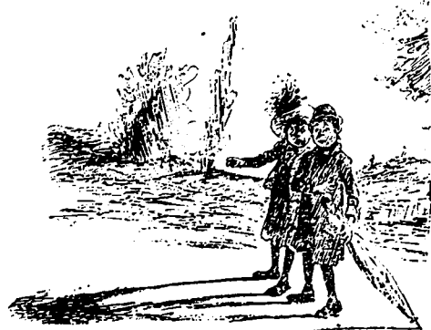
Cristabelle montrant leur ombre sur la voie... Vois donc, Vidocq ; nous sommes bien assez grands pour nous marier, à présent