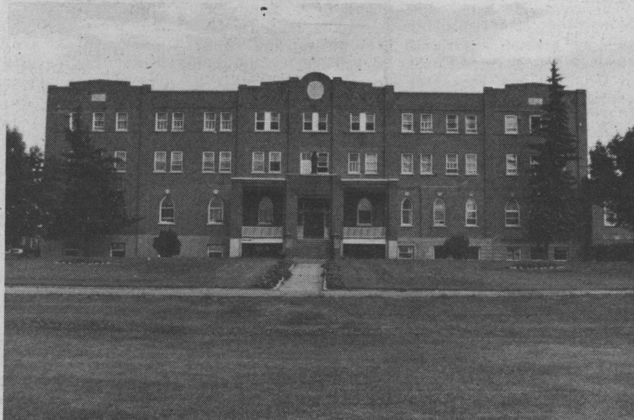
La Faculte St. Jean (above), and some of its students.