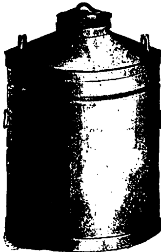
CANISTRE A LAIT "EMPIRE STATE."