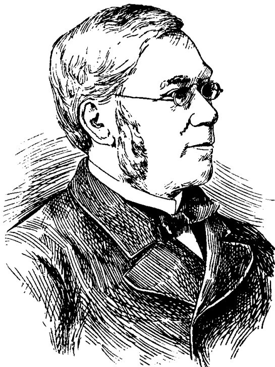
SIR OLIVIER MOWAT Lieutenant-Gouverneur d'Ontario

La ligne, par insertion - - - - - 10 cents Insertions subséquentes - - - - - 5 cent Tarif spécial pour annonces à long terme