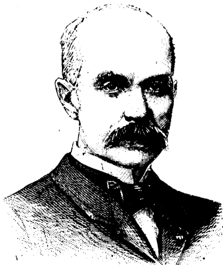
M. LE MYRE DE VILLIERS Envoyé extraordinaire