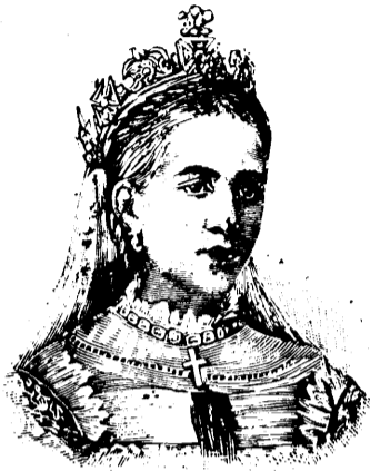
RANAVALONA III Reine de Madagascar

La ligne, par insertion - - - - 10 cents Insertions subséquentes - - - - 5 cents Tarif spécial pour annonces à long terme