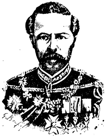
RAINILAIARIVONY Premier ministre de Madagascar