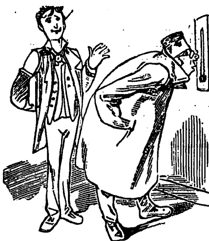
Dans l'antichambre 20 degrés, dans son cabinet 22, dans l'étude 18, et les presque en bras de chemise. Étrange !... étrange !...