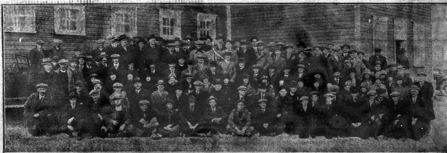
Groupe d'aviculteurs du district de Québec, réunis à la Station expérimentale du Cap Rouge, Qué., lors de la journée avicole du 14 octobre dernier.

Après garde le po il invoque tin de la F