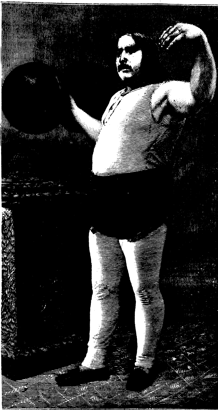
LOUIS CYR, L'HERCULE CANADIEN.

LE VOLEUR. journal artistique, littéraire et d'actualité, 59e année d'existence. Ce journal, essentiellement destiné à la famille, reproduit les meilleurs romans français parmi ceux qui peuvent être lus par tous, des articles d'actualités sur les hommes marquants contemporains, et sur les événements du jour une chronique spirituelle sur les faits de la semaine, et enfin un article de mode pour les mères de famille. Le Voleur paraît toutes les semaines, à Paris, 18, rue de l'Ancienne-Comédie.